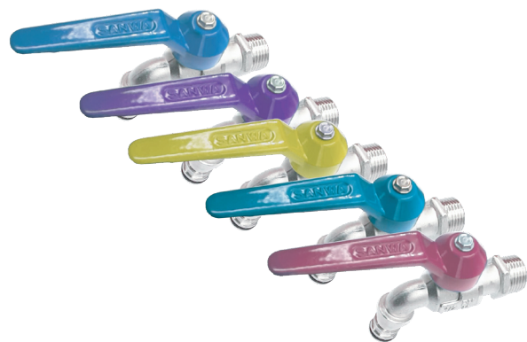
Dimension มิติ (mm.)